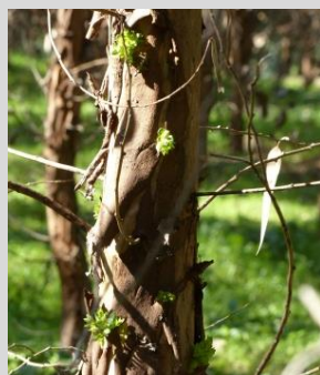
Rebentação no tronco