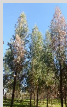
Copas a secar

Copa seca ou a secar, tronco com exsudações, rebentação ao longo do tronco, galerias larvares ou orifícios de emergência com presença de serrim.