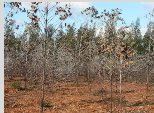
Povoamento jovem desfolhado