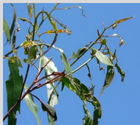
Desfolha em rebentos