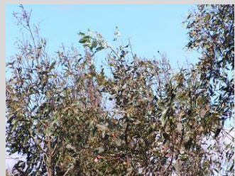
Desfolha no ápice