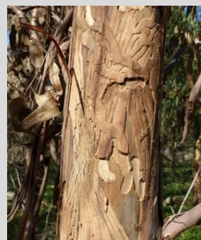
Galerias de larvas